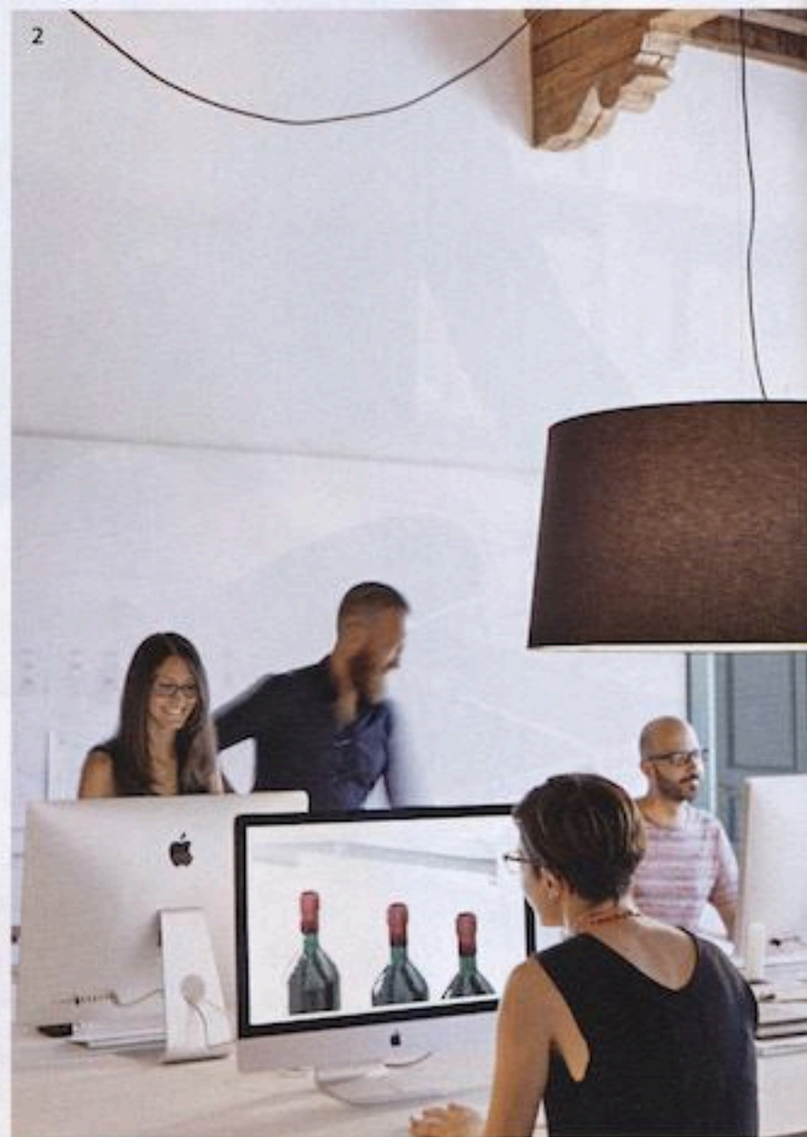
1 URKNALL Über dem großen Schreibtisch hängt „Big Bang“, eine der ersten Leuchten Vicentes für Foscarini 2 TEAMWORK Sechs Mitarbeiter sind im Studio beschäftigt 3 KUSCHELECKE Sofa „Fold“ (Verzelloni) eignet sich besonders gut für kleine Räume